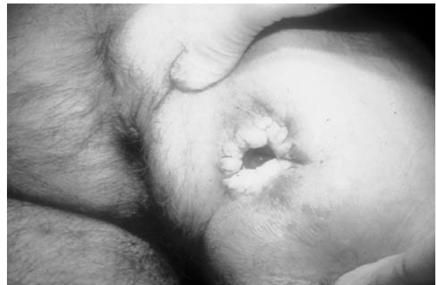
Fig. 3 - Trasformazione neoplastica di ulcera cronica della regione glutea.

lesionale oltre ad aumentare l'idratazione sistemica del paziente. Presso il nostro "Ambulatorio di ferite difficili" ottimi risultati si ottengono con prodotti quali lipogel o olio rilipidizzante Proxera®, i quali riequilibrano il film idrolipidico di superficie, preservando l'elasticità della cute e riducendo la perdita d'acqua transcutanea (TEWL).