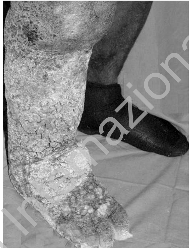
Fig. 2 - Elefantiasi arto inferiore destro.

La giusta idratazione è di fondamentale importanza per l'integrità della cute perilesionale, infatti se insufficiente porta a xerosi della cute. Essa può essere determinata da un'insufficienza arteriosa, dall'assenza o da una inappropriata medicazione che porta a morte cellulare, ostacolo alla migrazione delle cellule ed alla deposizione di collagene extracellulare. Il trattamento consiste nel cambiare medicazione utilizzando idrocolloidi, idrogel ed applicare emollienti ed idratanti sulla cute peri-