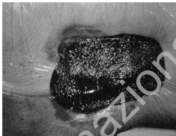
Fig. 4 - Terapia VAC in ulcera essudante contaminata della regione lombare.

L'eritema della cute perilesionale può essere determinato da una dermatite irritativa da contatto (DICI-feci e urine, medicazioni irritanti), da una dermatite al-