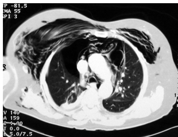
Figg. 1 e 2 - TC. Pneumomediastino con emopneumotorace destro e cospicuo enfisema sottocutaneo.

politraumi tali da richiedere l'ospedalizzazione, ricoverati presso la nostra Unità Operativa Complessa o in quella di Chirurgia Generale o in Terapia Intensiva. L'età media è risultata pari a 41 anni (range 25-83), il rapporto M/F 1,9.