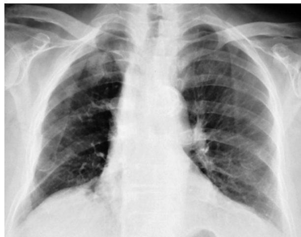
Fig. 3 - Completa risoluzione del caso precedente dopo drenaggio.

In particolare, un drenaggio pleurico è stato posizionato in 27 dei 30 pazienti con pneumomediastino associato a pneumotorace o emopneumotorace; tale trattamento è risultato risolutivo in 25 casi. Tre pazienti sono stati sottoposti a trattamento videotoracoscopico, d'emblée in 2 casi e post-drenaggio in 1, per perdite aeree prolungate; sono state eseguite, infine, 2 toracotomie, in un caso d'urgenza per instabilità emodinamica secondaria a gravissima emorragia, nell'altro post-drenaggio per mancato arresto dell'emorragia. Uno dei pazienti con lesione tracheale e quello con perforazione esofagea sono stati sottoposti ad intervento chirurgico di